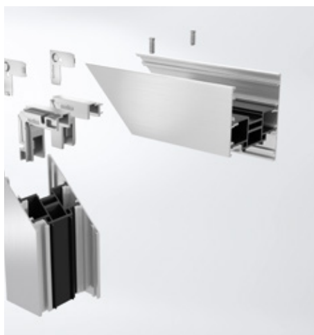
Varianta šroubovatelné rohové spojky Screw-type corner cleats are an option