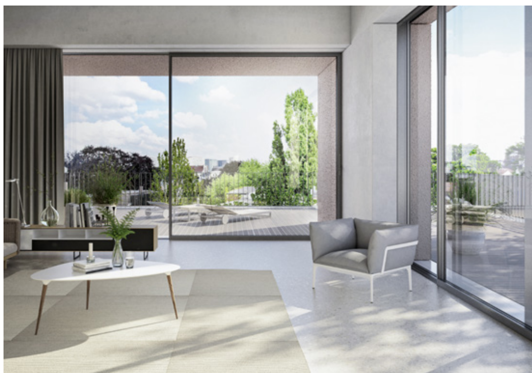
Tepelná izolace na úrovni pasivního domu Thermal insulation to passive house standard

Integrated SmartStop and SmartClose modules ensure more than just security during operation and increased user comfort. In the lift-and-slide versions, two further modules assist the user in lifting and lowering the moving vent. During lifting, an integrated operating aid helps the user by means of spring tension, making the vent even easier to open. During closing and lowering, another module, a handle damper, cushions the vents and operating handle. These two modules make even large-scale formats easy to operate.