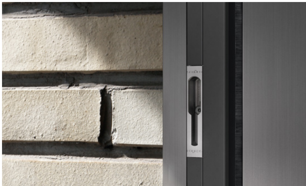
Varianta kování s plošně zalícovaným uzávěrováním v dveřním rámu Fittings option with flush-fitted locking in the outer frame

Posuvný systém Schüco ASE 60/80 je v současnosti jediný systém na trhu, u kterého lze použít jak kování pro jednoduché posuvné dveře tak i pro posuvné dveře se zdvihem - a to ve dvou variantách.