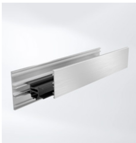
Posuvné spojení pro snížení bimetalického efektu Split insulating bar to reduce the bi-metallic effect